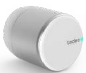
cerradura electrónica tedee para acceso sin llaves.