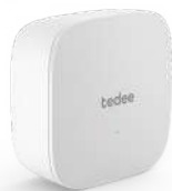
smart bridge tedee para administrar a distancia.